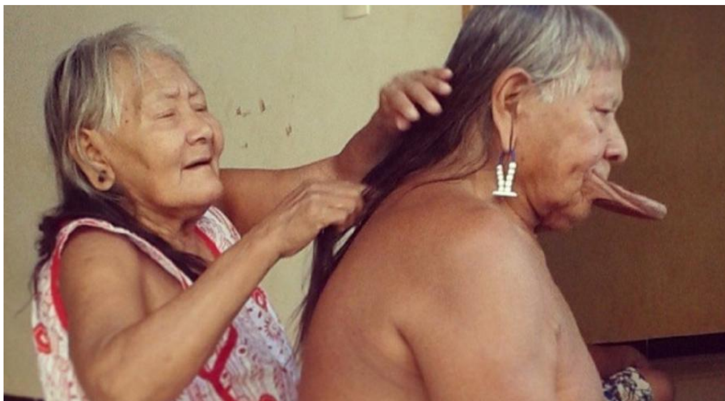
Bekwykà e Raoni Metuktire