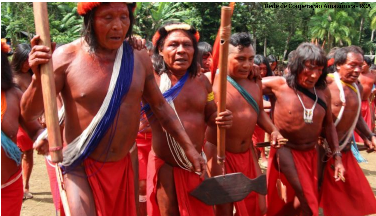
Wajãpi, comunidade indígena localizada em cidade do Amapá

O presidente Jair Bolsonaro sancionou, com vetos, a lei que estabelece medidas preventivas contra o coronavírus em comunidades indígenas, quilombolas e outros povos tradicionais durante a pandemia. Bolsonaro vetou, entre outros pontos, a exigência de fornecimento de acesso a água potável e distribuição gratuita de materiais de higiene, limpeza e de desinfecção para as aldeias indígenas.