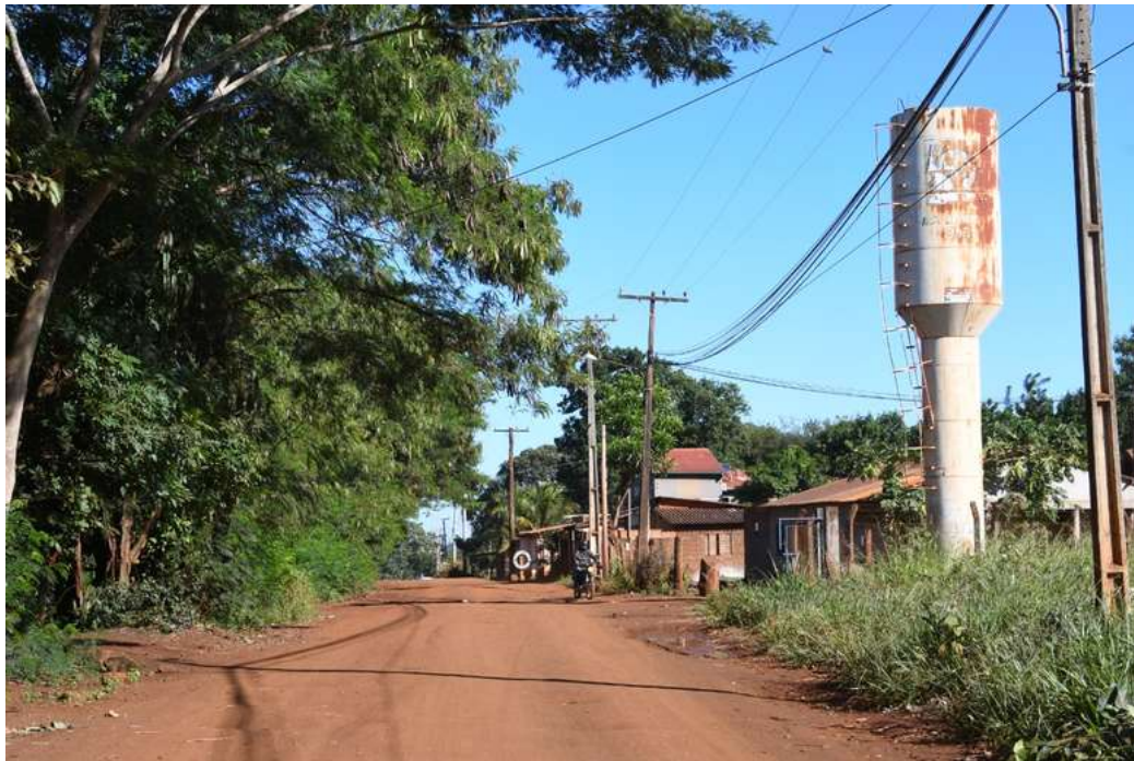
SES aponta primeiro caso em Reserva Indígena no Mato Grosso do Sul